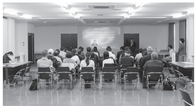
〈お仕事相談会での会社説明の様子〉

令和8年の11月にも同様の相談会の開催を計画していますので、ご興味のある組合員企業は、ぜひ参加をご検討ください。