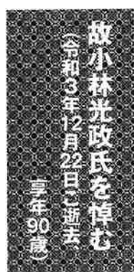
故小林光政氏を悼む (令和3年12月22日逝去 享年90歳)